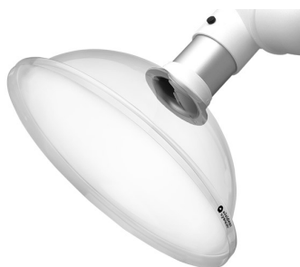
ALSIDENT Absaughaube rund, NW 100, d= 500 mm, weiß