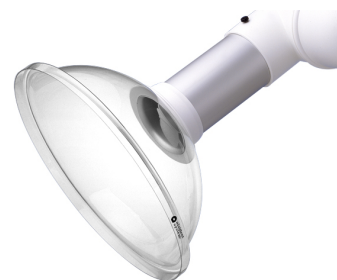
Campana de aspiración para brazo sistema 100