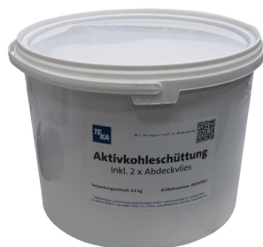
Carbón activo a granel, recarga de 3,5 kg