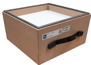
Filtro de partículas H13, 305x305x150 (+2*6)