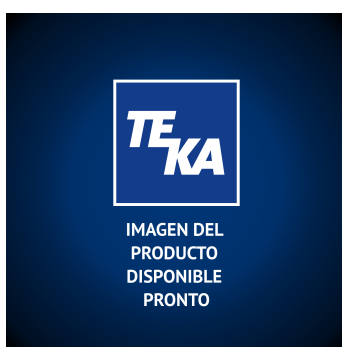
Filtro de carbón activo 337 x 230 x 212 mm Producto No.: 97059