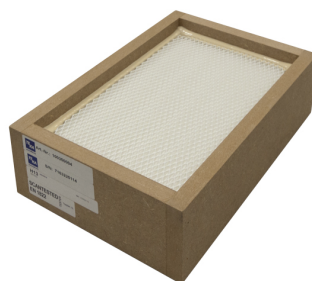
Filtro hepa H13, med. 337 x 230 x 100 mm Producto No.: 100350004