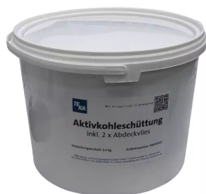
Charbon actif en vrac, 3,5 kg Référence de l'article : 100197507