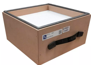
Filtre HEPA H13, 305x305x150 (+2*6) Référence de l'article : 10031