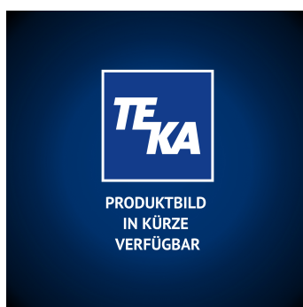
Set de pré-filtres M5 268x268x20 mm Référence de l'article : 10033