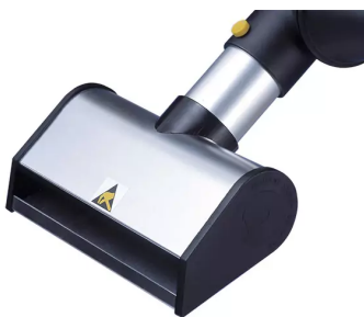
Buse à fente, diam. 50, antistatique Référence de l'article : 150206