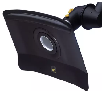
Hotte d'aspiration plate, diam. 50 antistatique Référence de l'article : 15033246