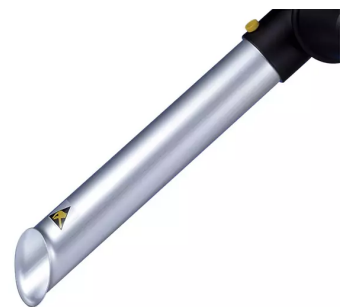
ALSIDENT Buse d'aspiration DN 50 (AS) Référence de l'article : 150316