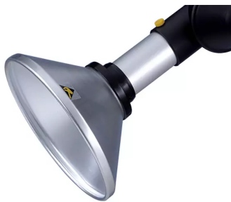
Hotte d'aspiration ronde, diam. 50, antistatique Référence de l'article : 150246