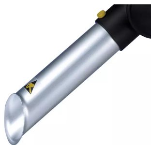
ALSIDENT Buse d'aspiration DN 50 (AS) Référence de l'article : 150216