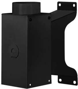
ALSIDENT Support mural, DN 75-50, noir Référence de l'article : 2195050