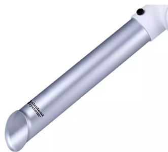
ALSIDENT Buse tubulaire DN 50, Référence de l'article : 15031