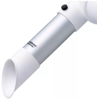
Buse d'aspiration diam. 50, tête en polypropylène Référence de l'article : 150225