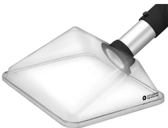
ALSIDENT hotte d'aspiration rectangulaire, DN 50 Référence de l'article : 1502422050001