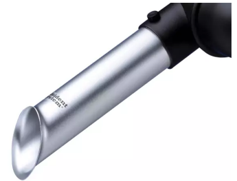
Buse d'aspiration, diam. 50 Référence de l'article : 15021001