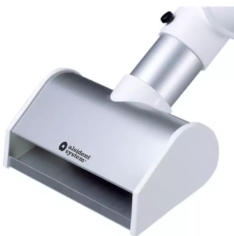
ALSIDENT Buse à fente DN 50 Référence de l'article : 150205