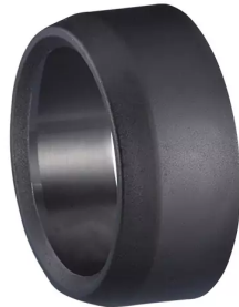
ALSIDENT Réduction 63 - 50 mm, noir Référence de l'article : 463506