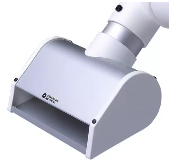
ALSIDENT buse à fente DN 50, Référence de l'article : 150105