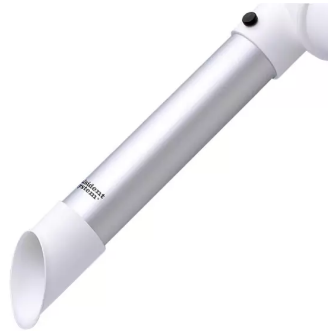
Buse d'aspiration diam. 50, tête en polypropylène Référence de l'article : 150325