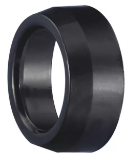
Rèductions 80 mm à 50 mm Référence de l'article : 480506