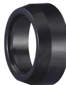
Rèductions 80 mm à 50 mm Référence de l'article : 480506