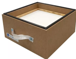
Filtre Hepa H14, 610 x 610 x 292 mm Référence de l'article : 50202146629