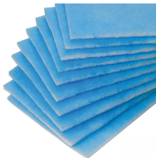
Jeu de 10 pré-filtres Référence de l'article : 10032