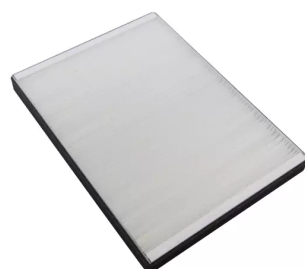
Filtre principal 283x206x25mm pour FilterCase Basi