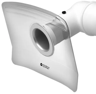
ALSIDENT Absaughaube flach, NW 100 Artikel-Nr.: 110042285