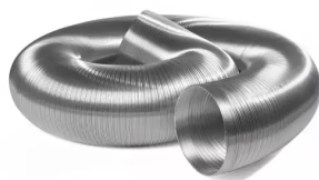
Abluftschlauch NW 160 Artikel-Nr.: 96303