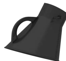
Absaughaube für Absaugarm NW 150 inkl. Drossel-