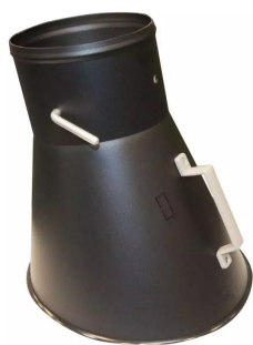
Metall-Absaughaube für Absaugarm NW 150