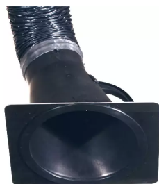
Düsenplatte Artikel-Nr.: 66210