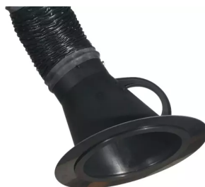
Düsenplatte Artikel-Nr.: 66220