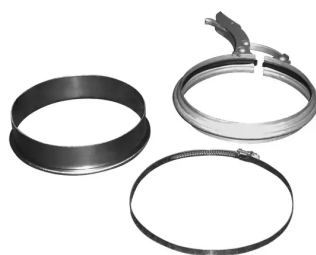
Anschlussmaterial NW 160 mm