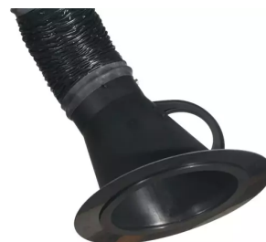
Düsenplatte Artikel-Nr.: 66220