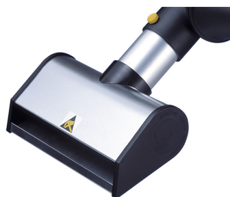
ALSIDENT Schlitzdüse NW 50 (AS), antistatisch Artikel-Nr.: 150206