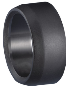
ALSIDENT Reduziermuffe 63 mm - 50 mm, schwarz Artikel-Nr.: 463506