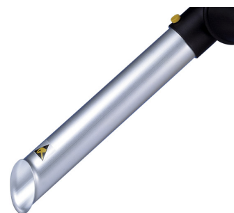
ALSIDENT Rohrdüse NW 50 (AS), antistatisch, Artikel-Nr.: 150316