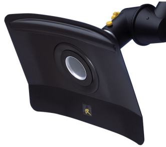
ALSIDENT Absaughaube flach, NW 50(AS), antistatisch Artikel-Nr.: 15033246