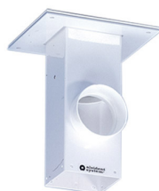
ALSIDENT Deckenkonsole, Abluft nach oben Artikel-Nr.: 225020