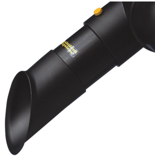
ALSIDENT Rohrdüse NW 75, Länge 250 mm