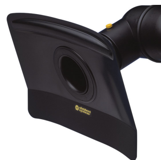
ALSIDENT Absaughaube flach, NW 75, 330 x 240 mm Artikel-Nr.: 17533246