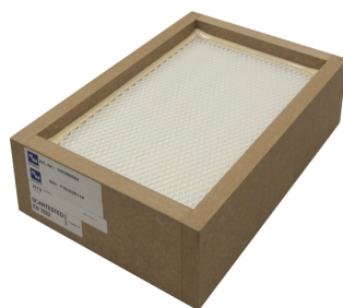
Hepafilter H13, Abm.: 337 x 230 x 100 mm Artikel-Nr.: 100350004