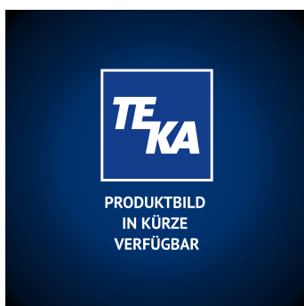
Aktivkohlefilter 337 x 230 x 212 mm Artikel-Nr.: 97059