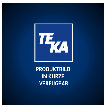
Aktivkohleschüttung für LFE Anlagen inkl. Macrofaltfilter G3, Abm. 62 x 62 x 48 mm Artikel-Nr.: 100197310