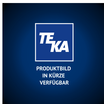
Macrofaltfilter G3, Abm. 62 x 62 x 48 mm Artikel-Nr.: 100350008