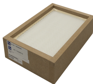
Hepafilter H13, Abm.: 337 x 230 x 100 mm Artikel-Nr.: 100350004