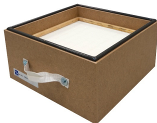
Partikelfilter H14, 610x610x292+6 Minip.100 Pa Artikel-Nr.: 50202146629